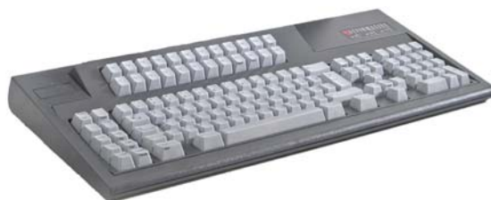
YESboard 122 schwarz